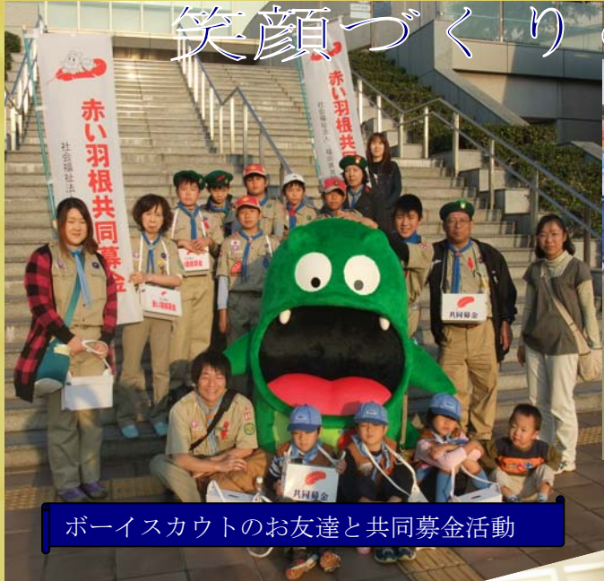
ボーイスカウトのお友達と共同募金活動