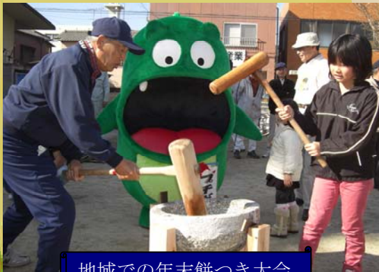
地域での年末餅つき大会