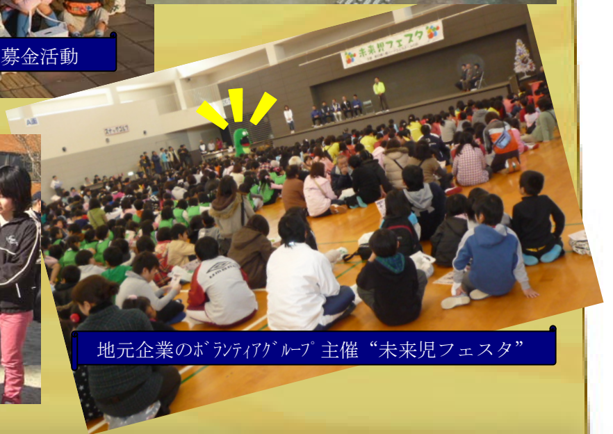
地元企業のボランティアグループ 主催 “未来児フェスタ”

“ちっちゃな、ほんの少しのボランティア活動”を応援するために誕生した、北九州市社会福祉協議会のアイドル プチボザウルスが、イベントを元気に盛り上げます！