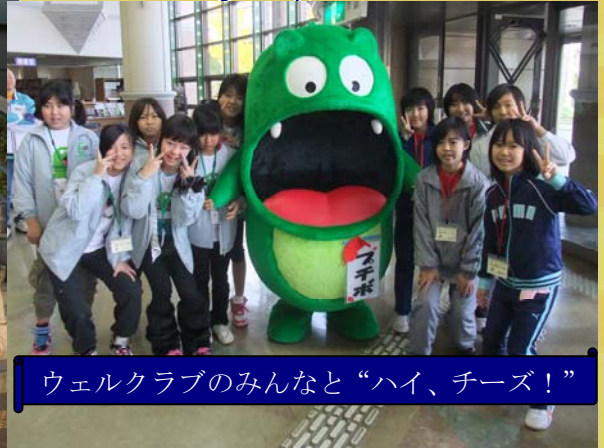
ウェルクラブのみんなと“ハイ、チーズ！”