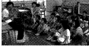
読み聞かせ風景(城野市民センター)

さらに、城野校区社協では、市民センターのキッズルームを活動拠点とした読み聞かせ会、人形劇など、子ども達とのふれあいの場を多くすることに取り組んでいます。