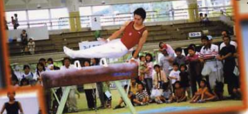
穴生学舎スポーツ大会