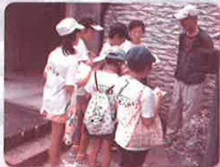
子どもたちの見守り活動