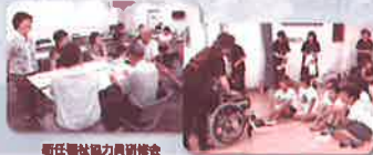
新任福祉職員研修会