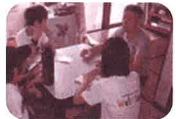
次世代地域福祉活動者育成事業(ウェルクラブ活動)

福祉協力員に同行し、年長者の見守り訪問をしたり、車いすの操作を体験したりして、子ども達の「思いやりの心」を育てています。