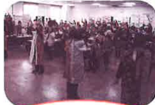
会場は多くの来場者で 賑わいました！！