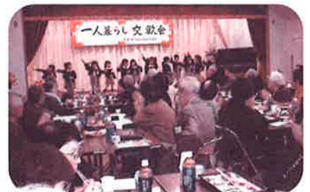
一人暮らし年長者行事