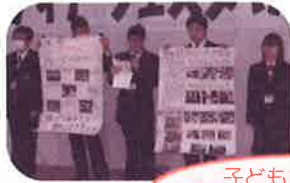
子どもたちによる ボランティア活動発表

八幡西区ボランティア・市民活動センター 〒806-0030 北九州市八幡西区山寺町6番30号 TEL/FAX642-0407