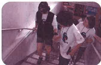
次世代地域福祉活動者育成事業 ウェルクラブ活動