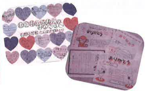
歳末たすけあい見舞品配布事業 すてきなお礼状が届きました