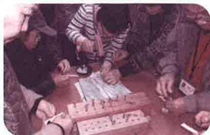
障がい者(児) ふれあいバスハイク