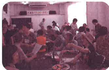
高齢者のサロン活動