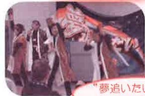
“夢追いたい”による よさこい演舞