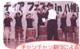
チャンチャン劇団による オープニング