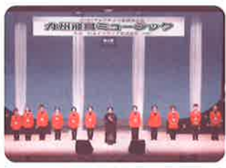
第23回チャリティー歌謡発表会の益金として