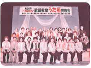
第26回発表会のチャリティー募金をいただきました