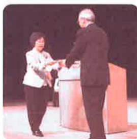
八幡西区婦人会連絡協議会

八幡西区社会福祉協議会 ボランティア・市民活動センター TEL/FAX 642-0407