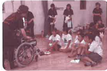
ウエルクラブ活動