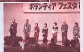
ボランティアフェスタ