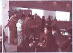
茶道ボランティアによる茶席