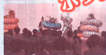
オープニングセレモニーはテンポよく舞う北九州市の郷土芸能として定着している折尾神楽