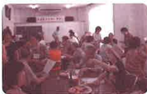
高齢者のサロン活動

1 権利の擁護と相談体制の充実 ・ 心配ごと相談所の運営(毎週1回) 2 社会参加・自立の支援 ・ 高齢者のサロン事業の推進 ・ シルバーひまわり送迎サービスの実施 ・ 障がい者(児)ふれあいパスハイク、年長者(障がい者)作品展の実施 3 調査・研究・提言