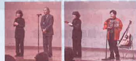
実行委員による「花は咲く」をハンドベル前奏で、会場のみなさんと合唱しました。

2月23日（日）に九州共立大学「自由ヶ丘会館」において『第11回ボランティアフェスタin八幡西』が開催されました。15のボランティアグループにPRをしていただき、ボランティア相互の情報交換や交流が行われていました。