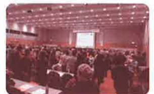
区民児協と校(地)区社協の合同研修会