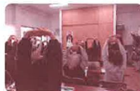
高齢者のサロン活動