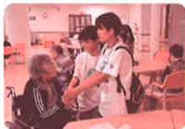
ウェルクラブ活動