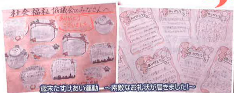
歳末たすけあい運動～素敵なお礼状が届きました！～

みなさまからの募金は、福岡県共同募金会八幡西区支会が配分し、八幡西区内の福祉の増進に活かされています。また、その一部は県内広域を対象とした社会福祉施設等の充実や災害準備等にも役立てられています。