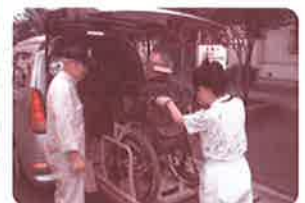
シルバーひまわりサービス