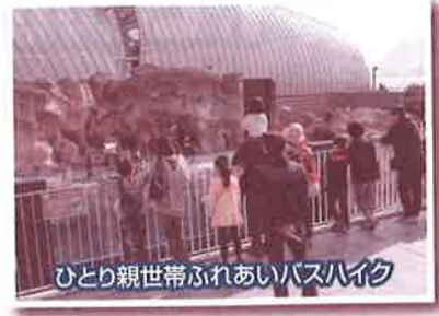
ひとり親世帯ふれあいバスハイク