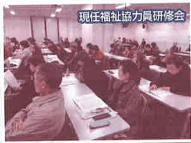
現任福祉協力員研修会