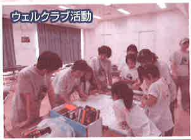
ウェルクラブ活動