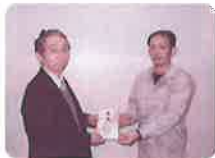
三菱化学エンジニアリング労働組合