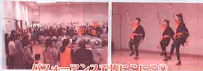
パフォーマンスで皆にこにこ♡