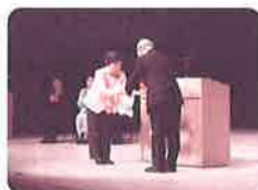
八幡西区婦人会連絡協議会

毎年、チャリティ芸能まつりにおける寄付をいただいています。第31回まつりにて贈呈式を執り行いました。