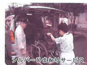
シルバーひまわりサービス