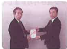
福岡ひびき信用金庫イングスクラブ

職員で結成されたイングスクラブのみなさんによる年末の街頭募金活動を中心に、福岡ひびき信用金庫本店及び窓口募金を毎年ご寄付いただいています。