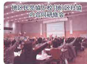
地区民児協と校（地）区社協の合同研修会