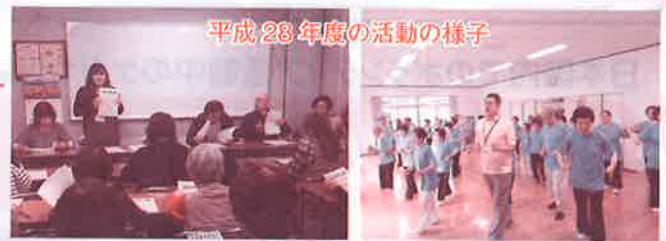
平成28年度の活動の様子

地域の活動で、お困りのことがありましたら、地域支援コーディネーターにご相談ください。