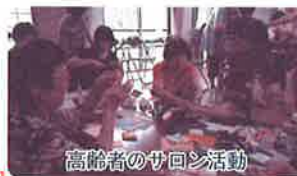
高齢者のサロン活動