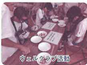
ウェルクラブ活動