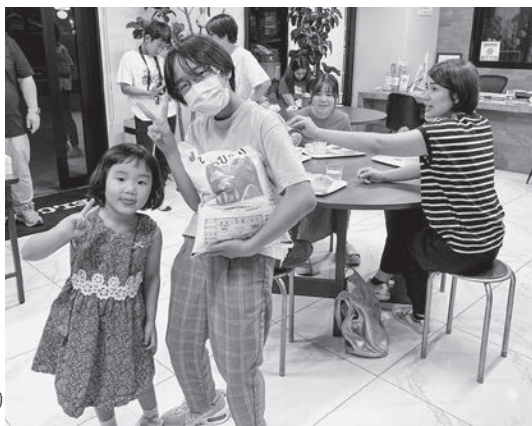
お米をかかえて「はい！ポーズ！」

これらの温かな善意の品々は、社会福祉協議会を通じて、小倉北区内の子ども食堂や自立支援団体をはじめ、介護施設や各種ボランティア団体、生活困窮世帯などに贈呈されました。