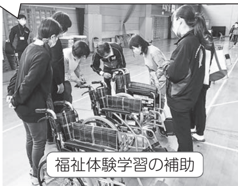
福祉体験学習の補助