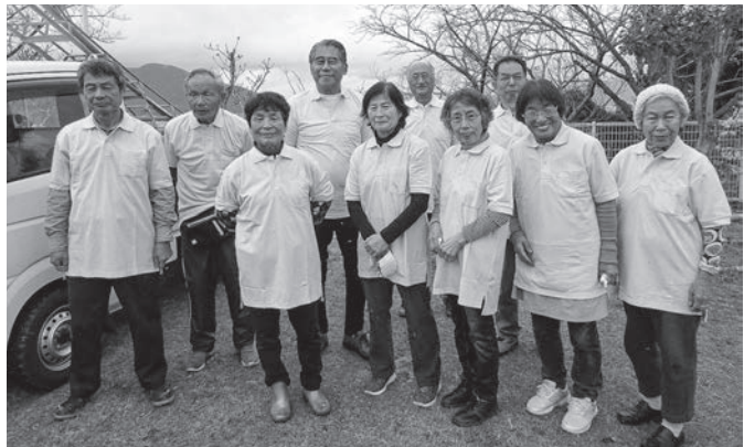
お揃いのポロシャツに袖を通した 周望学舎グリーンボランティアの会のみなさん

「困っている人の助けになりたい」「誰かを笑顔にする役に立ちたい」。そんな想いのこもった善意の品物が社会福祉協議会に届けられました。