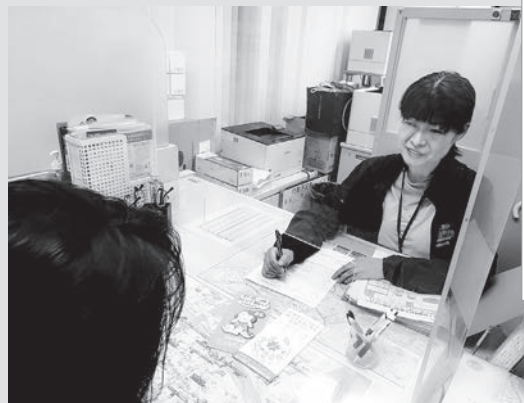
生活困窮者自立支援事業

住民主体の助け合いのしくみづくりやボランティア・市民活動の充実を図るとともに、生活困窮者自立支援事業や地域福祉権利擁護事業といった既存のしくみの充実も行います。また、活動のための財源づくりにも取り組みます。