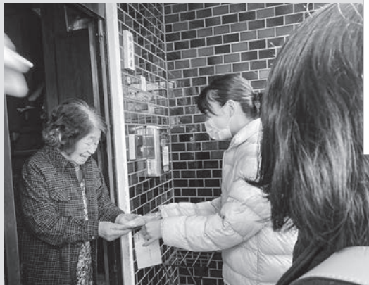
中井校区北小倉社協

困りごとに気づき、受け止める見守り活動や場づくり（サロン活動など）の推進を図るとともに、福祉教育や広報啓発の充実に取り組みます。