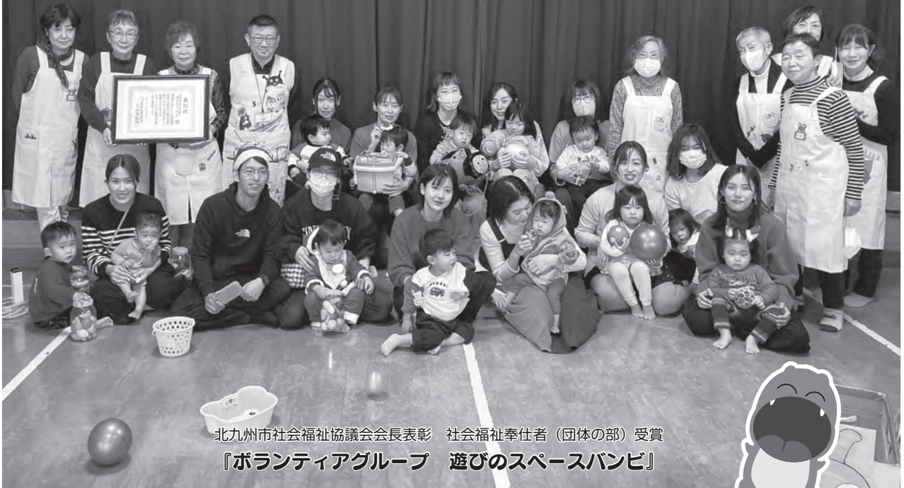
北九州市社会福祉協議会会長表彰 社会福祉奉仕者（団体の部）受賞 『ボランティアグループ 遊びのスペースバンビ』