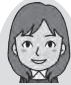
泉台校区担当 地域支援 コーディネーター

今年の年賀状も、可愛いキャラクターや干支の巳のイラスト、折り紙などでデコレーションされ、「見守っていますよ」の気持ちを込めて一生懸命に作成しました。