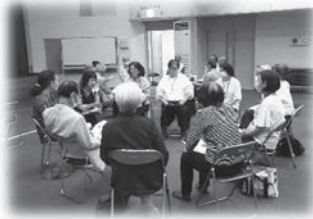
小地域福祉活動計画の策定・推進

「困りごとを抱える人を地域全体で見守り、平時もいざという時も安心して暮らせるしくみ」を目指します。