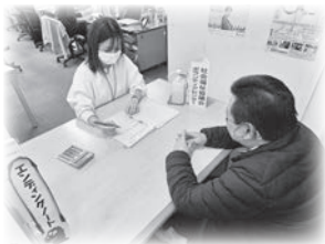
CSWの配置による個別支援と地域づくりの一体的展開

「地域の力と専門職の知を結集し、北九州全体で持続可能な福祉のまち」を目指します。