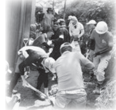
災害ボランティア養成講座の実施