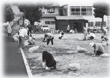
境川公園清掃活動