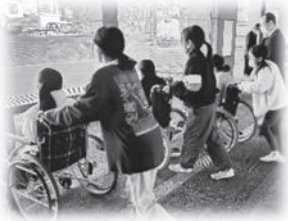
ふくしの出前授業等の福祉教育の実施

「福祉を自分ごととして考え、誰もが役割を持ち、参加できる地域共生社会の実現」を目指します。