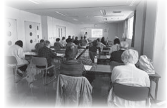
福祉協力員等研修の開催