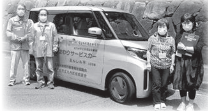
シルバーひまわりサービスの実施