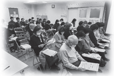
福祉協力員委嘱状交付式

地域福祉活動は、特定の人が行う特別な活動ではなく、地域に住む誰もができる日々の声かけや気づきの積み重ねが土台です。中井校区の取り組みは、そうしたふれあいや支え合いの気持ちが根づいた活動として着実に広がっています。