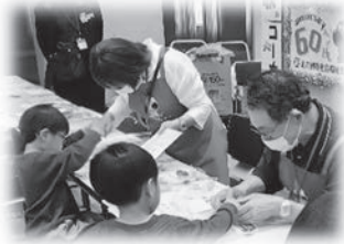
小倉北区子どもまつりでの福祉体験の実施