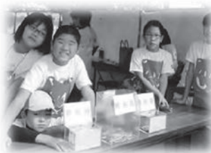
共同募金への理解と運動への参加促進