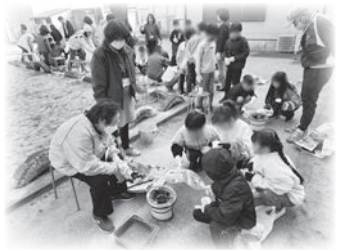
七輪火おこし体験