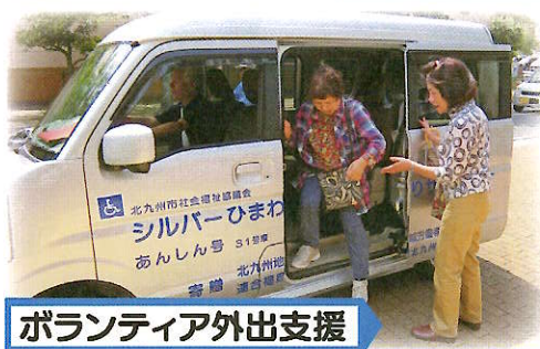
ボランティア外出支援