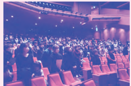
▲ひびしんホールで行われた民児協一斉改選

民生委員・児童委員は、地域住民の一員として、それぞれが担当する区域において、住民の生活上の様々な相談に応じ、行政をはじめ適切な支援やサービスへの「つなぎ役」や、高齢者や障害のある方の見守りや安否確認などにも重要な役割を果たしています。