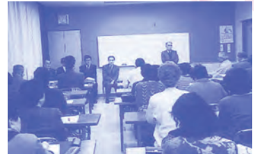
ふれあいネットワーク事業説明会 (平成5年)

——自治区会の組長になった時、自治区会の女性部会の役員のお誘いがありました。その後、女性部会に福祉協力員の募集がかかり、もともと祖父が地域活動に熱心に取り組んでいたものですから、深く考えずみなさんのお役に立てればと夢中で始めました。福祉協力員や役員、区社協の職員さんで何度も集まり勉強会を重ねましたね。