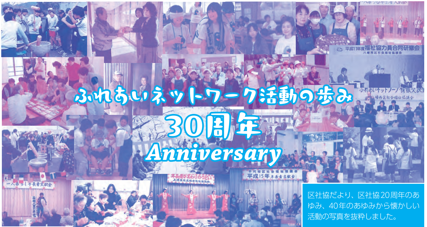
区社協だより、区社協20周年のあゆみ、40年のあゆみから懐かしい活動の写真を抜粋しました。