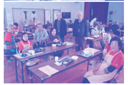
昼食交流会(上:平成8年/下:令和5年)