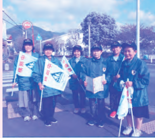
▲子ども見守り隊（大原地区）

民生委員活動と社協活動は、地域福祉活動の両輪と言われます。『みんなが安心して暮らせる支え合いのまちづくり』のために、様々な活動をしている民生委員・児童委員について知っていただき、活動へのご理解とご協力をお願いします。