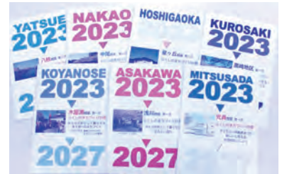
各校(地)区社協の5年間の活動計画書