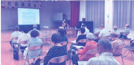
池田校区 (福祉協力員の研修交流会)

33校(地)区社協の福祉協力員数 1,880名 見守り対象世帯数 30,927世帯