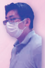
インクル八千代 清水事業所長

清水事業所長 地域の方々にあたたかく支えられ、45年もこの地で事業所を運営できています。地域のために何かできればとずっと考えていました。