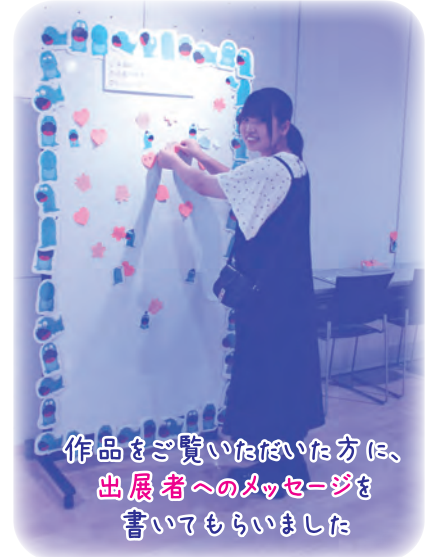
作品をご覧いただいた方には、 出展者へのメッセージを 書いてもらいました