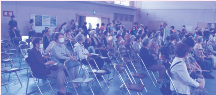
▲一人暮らし年長者交歓会

地域の困りごとを話し合う毎月1回の会議では、保育所、福祉施設、警察署の方等に参加してもらい、その解決に向けてみんなで一緒に考えます。アイデアを出し合ったり、役割を分担したりすることでみんなでつながっている黒崎です。