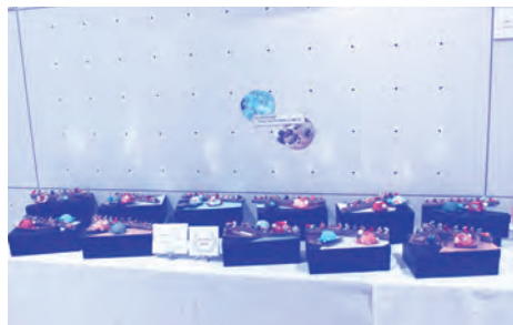
▲難を乗り越え元気いっぱいかけめろ (11個)