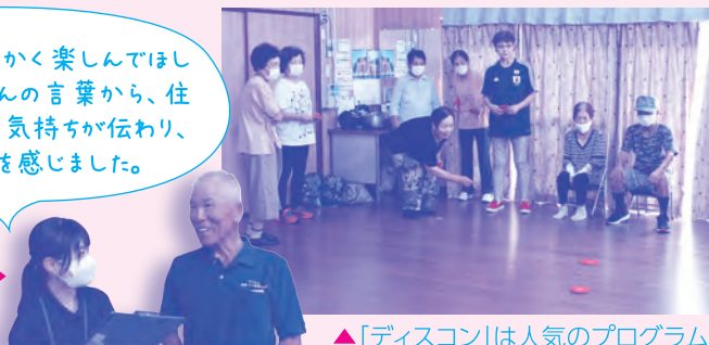
▲「ディスコン」は人気のプログラム

「賛助会費」や「赤い羽根共同募金」、さまざまなご寄付等は地域活動の運営費として活用させていただいております。「賛助会員入会・各種募金」は、各校(地)区社会福祉協議会、または八幡西区社会福祉協議会で受付しています。皆さまの心温まるご協力を心よりお待ちしております。