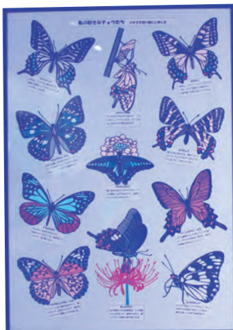
▲私の好きなチョウたち