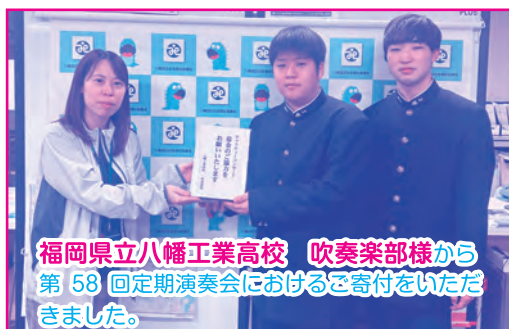
福岡県立八幡工業高校 吹奏楽部様から 第58回定期演奏会におけるご寄付をいただきました。