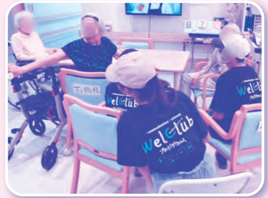
▲施設に訪問し交流しました