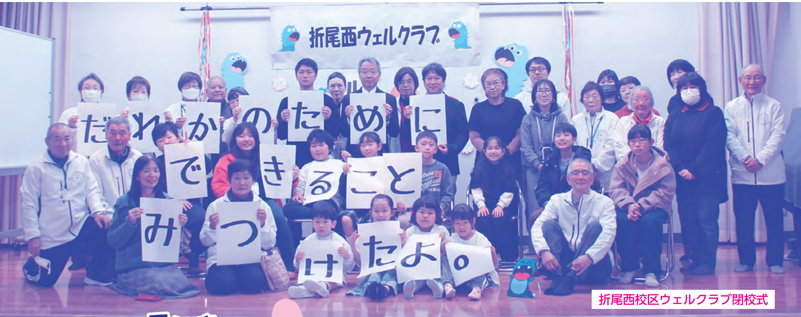
折尾西校区ウェルクラブ閉校式