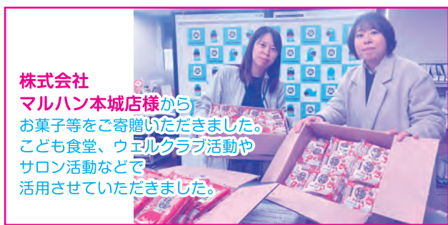
株式会社 マルハン本城店様から お菓子等をご寄贈いただきました。 こども食堂、ウエルクラブ活動や サロン活動などで 活用させていただきました。