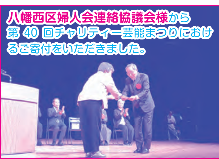
八幡西区婦人会連絡協議会様から 第40回チャリティ会芸まつりにおける ご寄付をいただきました。