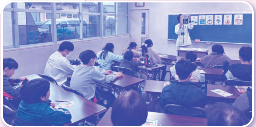
▲障害のある人が、支援を必要とすることを伝えたり、障害のある人に対応した施設・設備やルールなどの存在を示したりする福祉マークを楽しく学びました