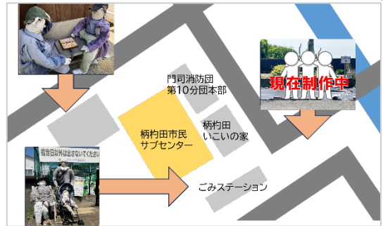
▲柄杓田 かかしマップ

海と山に囲まれ、豊前海に面した漁業と農業の町です。海岸線には北九州空港も望め、晴れた日には飛行機が飛び立つ姿も見るすることができます。