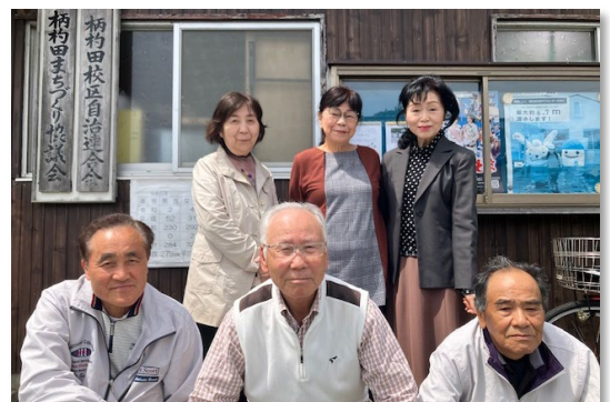
▲長谷会長と活動者のみなさん

柄杓田校区では、今後も関係機関・団体と協力しながら、計画の取り組みを進めていきます。