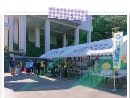
平成30年7月 門司区に設置した臨時災害ボランティアセンター