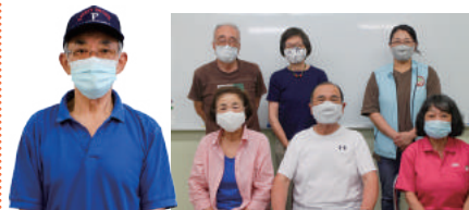
▲河内会長と活動者の皆さん

コロナ禍の中でも「今できること」に目を向けて、萩ヶ丘校区社協では活動計画を指針として活動しています。