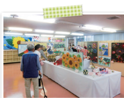
令和元年 生きがづくり年長者作品展