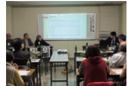
▲体験報告会の様子

また、見守り対象者を把握する際の意識も変わってきたと活動者の方からお話がありました。