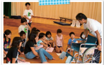
ウエルクラブ活動での福祉体験学習