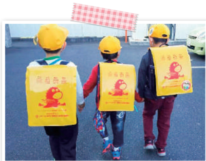
小学校新1年生ハンドセルカバーの贈呈