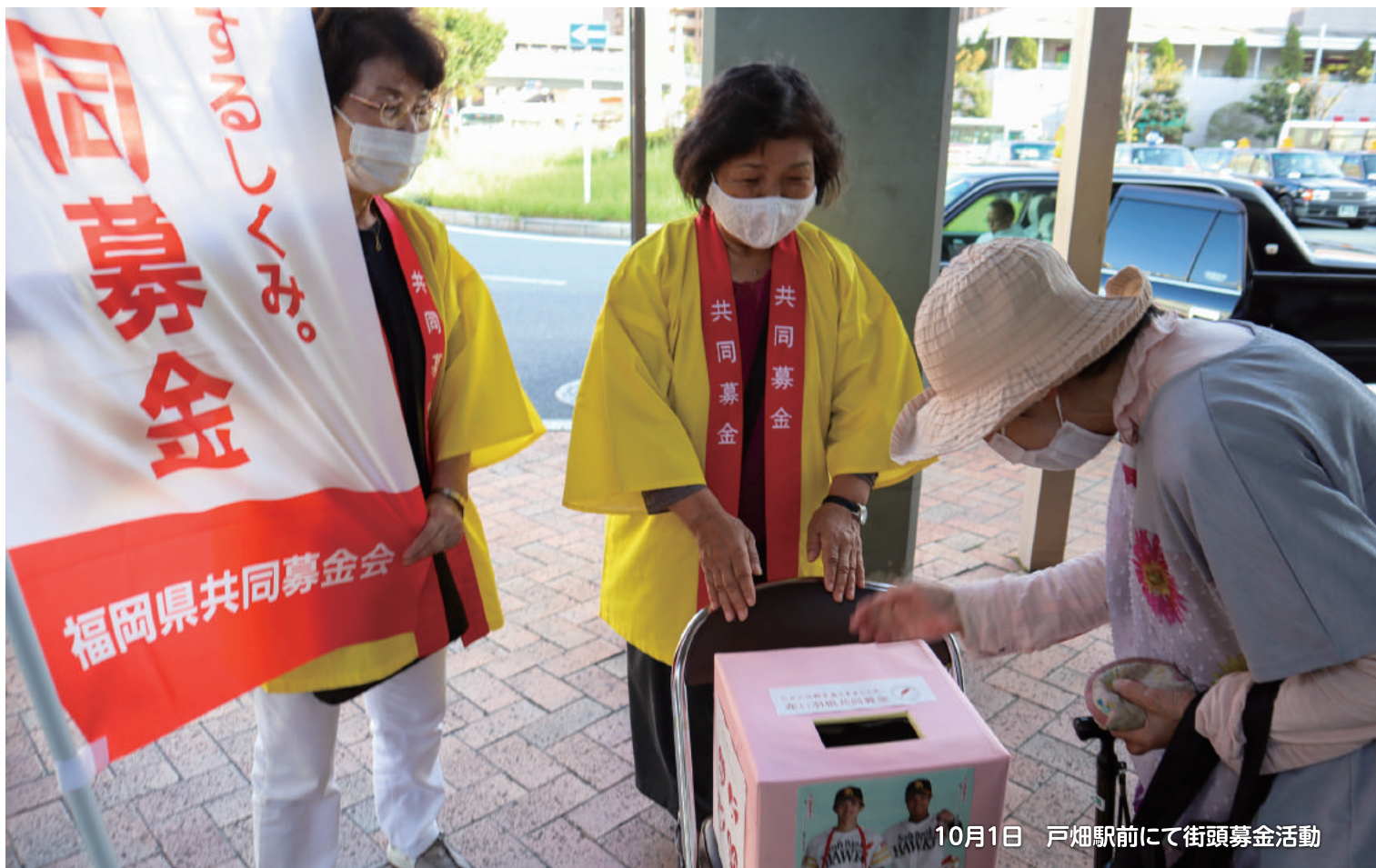
10月1日 戸畑駅前にて街頭募金活動