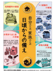
▲オリジナルのチラシ