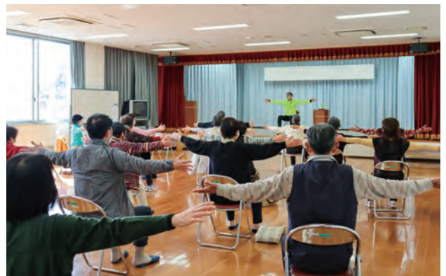
▲令和3年3月のサロンの様子

コロナ禍で活動の制限はありますが、参加者の方はサロンの日を心待ちにしておられ、自然と会話も弾み、楽しい集いの場となっています。