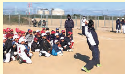
女子ソフトボール部によるソフトボール教室