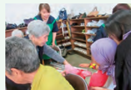
園児から花束のプレゼント♪