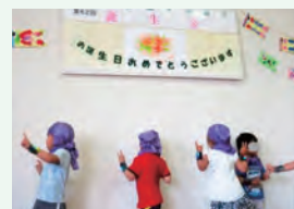
季節に合った遊戯を披露しています