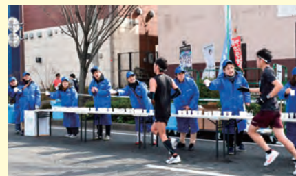
北九州マラソンの様子 タカギの浄水器で作った浄水にて給水ボランティア!

これからもタカギは、支えてくださる北九州の皆様へ少しでも役立てるよう様々な取り組みに貢献して参ります。