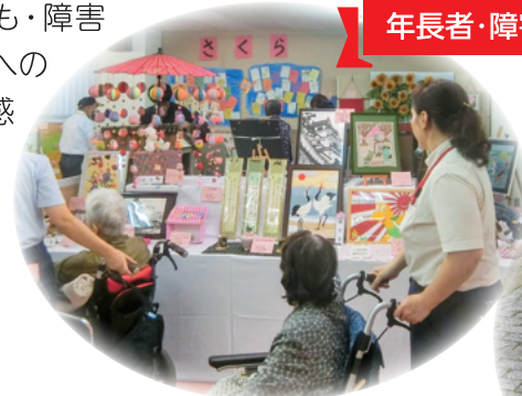
年長者・障害者作品展

赤い羽根共同募金は、地域で支援を必要とする子ども・障害者・高齢者をはじめ、ひとり親世帯、生活困窮世帯などへの支援や、自然災害による被災地復興支援、新型コロナウイルス感染下での子どもや家族、居場所を失った方への緊急活動支援にも役立てられています。