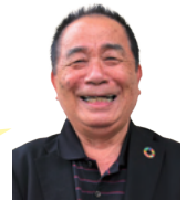
▲今町校区社協 福丸会長