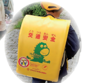
ランドセルカバー