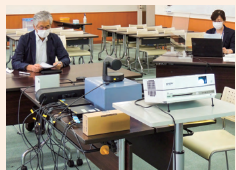
オンライン研修風景

今後も、withコロナの時代においても、継続して受講者のニーズに合った研修を提供できるよう工夫を重ねていきます。