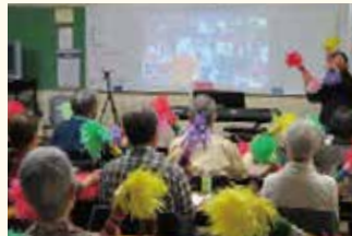
▲周望学舎:歌って健康コース オンラインによるボランティア実践

年長者研修大学校に通うと、自分にあった学びをしながら、さらに健康でいきいきとした生活を送ることができます。地域活動などの社会貢献も行いながら、人生をこれまでよりももっと豊かにすることができます。