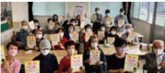
▲連絡調整会議は毎回わいわいがやがや

隣近所や地域の商店、市民センターでのサロン活動等、地域みんなで色々な角度から日頃の見守り活動に協力しており、社協と民生委員児童委員協議会(以下、民児協)が一丸となって、活動していることも自慢の一つです。連絡調整会議では、みんなで意見を出し合い、笑いも絶えず、とても和気あいあいとした雰囲気話し合いをしています。