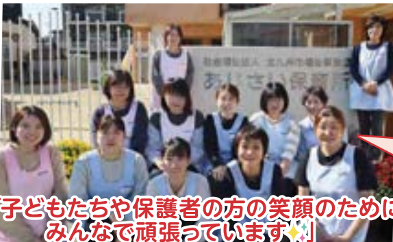
「子どもたちや保護者の方の笑顔のためにみんなで頑張っています！」

子どもたちを見守る地域の方の温かい目が増えることは、保育所だけでなく保護者の安心感にもつながっています。これからも地域との交流を大切にしながら、子どもたちの成長を見守っていきたいと思います。