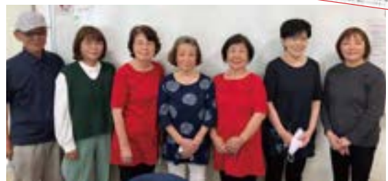
▲(右中央)片岡会長と民生委員のみなさん