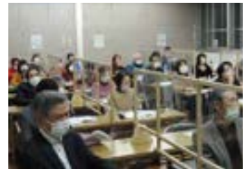
▲牧山地区社協研修風景

講座を実施することで地域で話し合いの場が生まれ、みんなで連携して活動するようになり、少しずつ地域福祉への意識が高まってきている校(地)区も出ています。ボランティア大学校ではこれからも研修を通して、地域福祉活動を応援していきます。