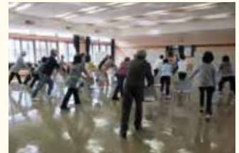
▲穴生学舎:健康スポーツコース 準備運動