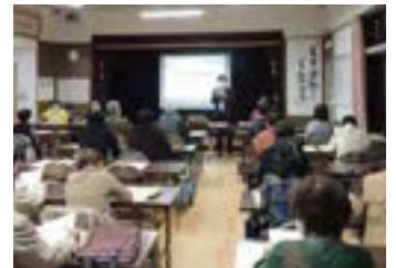
▲陣原地区社協研修風景