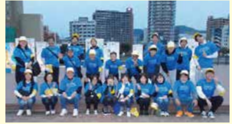
▲2021年コ克蘭タン祭り

今後も、地域社会貢献活動へ積極的に参加し、地域の皆様とともによりよい地域社会を作っていくことができるよう、取り組んでまいります。