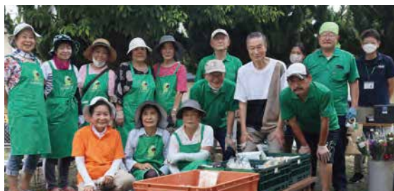
▲ほっこり朝市で活躍している活動者のみなさん

また、令和4年度からは地域の子どもたちや一人暮らし高齢者の孤食防止や交流の場とすることを目的に、市民センターで地域食堂を開設しました。「おおばる食堂」と名付けたこの地域食堂には、近隣農家やスーパー、寺院からは野菜やお米、お菓子が提供され、地元企業からは協賛金が寄せられています。子どもたちの保護者や地域の人たちからなるボランティアチームが、食事を作り、様々な人・団体・企業と連携した取組みになっています。