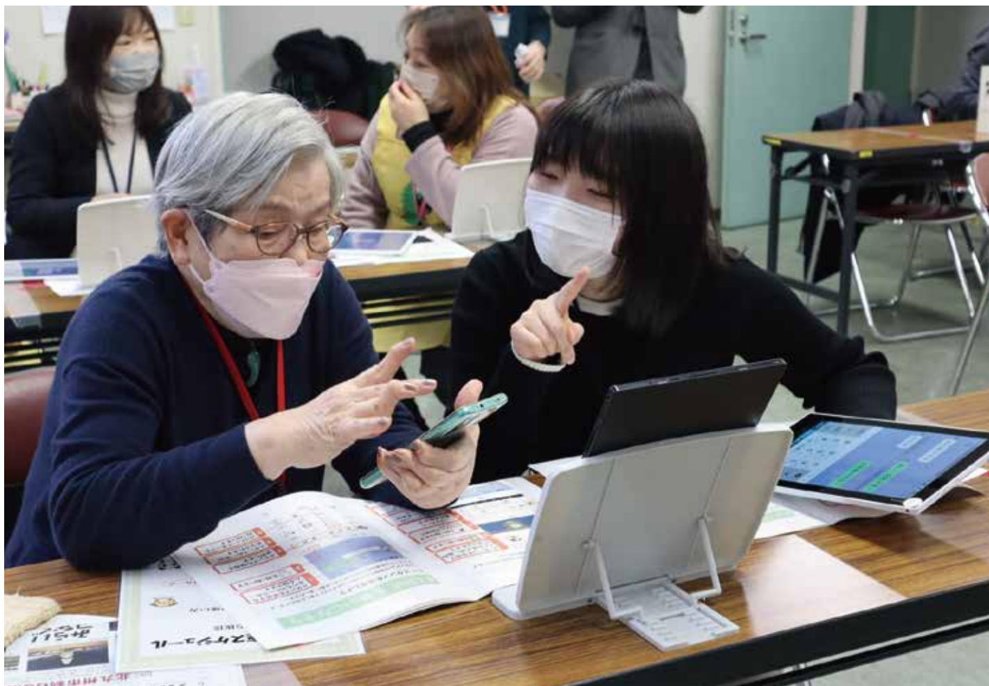
表紙写真 LINE講座の様子