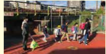
▼地域学生の登校見守り隊の様子