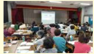
▲「簡単きれい好印象メイク講座」風景

社会コミュニケーション部門では Kirei Lifestyle 実現にお役立ちする啓発活動によって社会のサステナビリティに貢献する取組みを進めています。