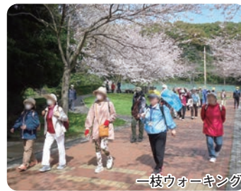
一枝花ウォーキング