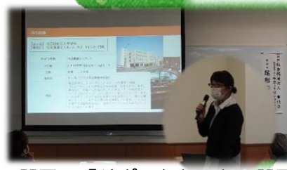
▲門司区『サポートセンター門司』