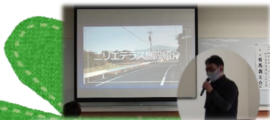
▲小倉南区『ニリエテラス ベーシック』

ボランティアのみなさんに、受入れ施設の事や活動の楽しさ、充実感を知ってもらうため、施設見学・ボランティア体験会を行いました。