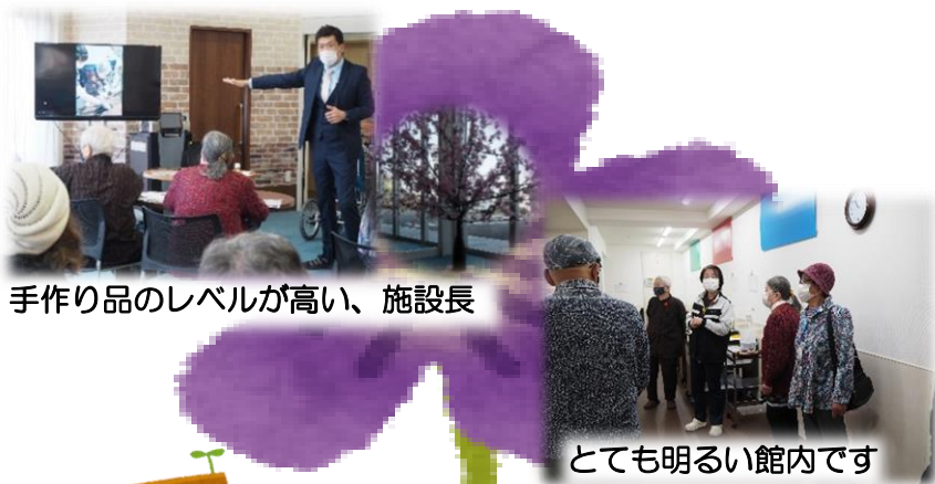
手作り品のレベルが高い、施設長

参加者も「また来たい」、「とても気に入りました」など、高評価で今後の活動に期待が持てました。