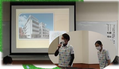
▲小倉北区『北九州シティホーム』