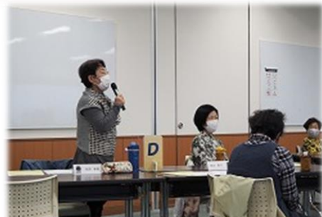
自己紹介（質問カードでコミュニケーション）

「集う・繋がる・語る」のテーマに相応しく、このコロナ禍に良い交流の場となりました。参加者のアンケートには、たくさんの「ありがとう」が書き記され、テーマとなった言葉の大切さを実感する内容でした。