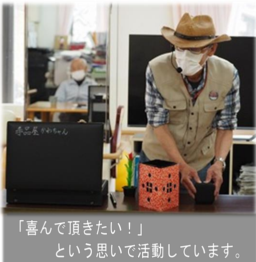
「喜んで頂きたい！」 という思いで活動しています。

家族も理解があり、応援してくれています。そして、芸能披露は、見ている皆さんの笑顔を見るとやっていて良かったと思います。今後も何かしら小さなことでも社会貢献できれば、と思っています。