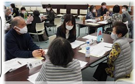
グループワークで交流会