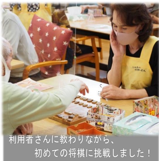
利用者さんに教わりながら、初めての将棋に挑戦しました！

介護支援ボランティアとして登録し、実際に活動している風景を取材させていただきました！