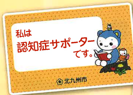
認知症サポーターカード