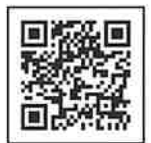
認知症サポーターメール QRコード

メールに登録いただくと、定期的に認知症に関する知識や講演会等の情報を配信いたします。また、市内の認知症高齢者等が所在不明となった場合、警察に届出のあった情報を元に、行方不明者情報を配信し、早期発見・早期保護へのご協力もお願いしています。登録は右のQRコードを読み取り、空メールを送信して行います。