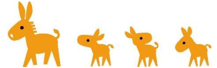
認知症サポーターキャラバン マスコットキャラクター ロバ隊長