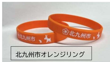
北九州市オレンジリング