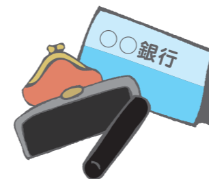
(利用料は令和7年3月現在)