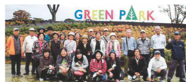
のびのびサロン、グリーンパークへ