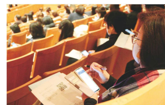
坂本先生の講演ではウェブを活用したコメントの投稿や投票を行う場面も