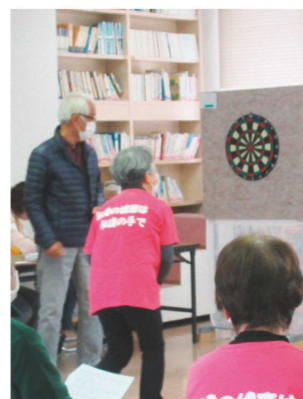
子どもから大人まで大盛り上がり

地道なことですが、地域の方や子どもたちと少しずつ親密になれる実感もあります。大変なこともありませんが、子どもたちから元気ももらいながら、日々頑張っています。