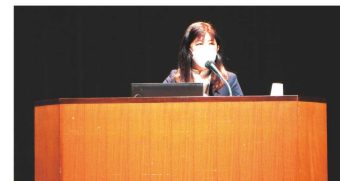
子育て支援課 大和係長

全体を通して、新任委員を含めこれから主任児童委員活動を行う上での参考となる研修でした。