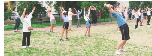
朝日を浴びながら体を動かしてリフレッシュ