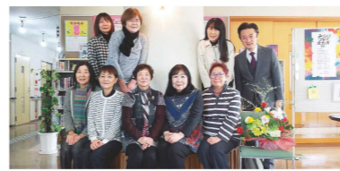
引野地区民生委員児童委員協議会のメンバー

今後も地域の皆さんや、各関係機関のご支援を頂きながら頑張っていきたいと思っています。