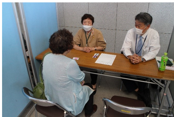
よろず相談会の様子

広報紙(市政だより、市社協だより、市民児協だより)、ホームページ(市社協、ウェルとばた)への記事掲載、北九州市公式SNS「好きっちゃん北九州」への投稿、各市民センター、ウェルとばた館内にチラシ配付等を行い、活動を周知しました!