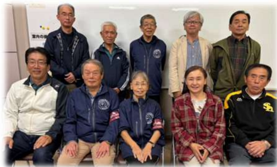
小地域福祉活動計画 第一次計画策定委員