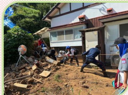
災害ボランティア活動

子どもの居場所づくり応援基金への寄付金は、市内の子ども食堂の開設や運営に 対する助成金として活用させていただきました。