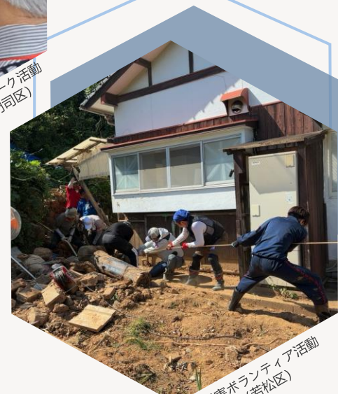
災害ボランティア活動 （若松区）