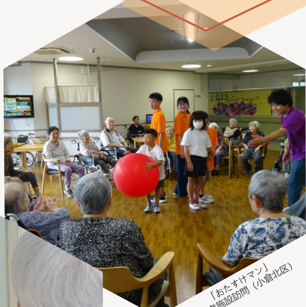
「おたすけマン」 高齢者施設訪問（小倉北区）