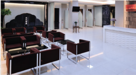
▲明るくモダンなロビー