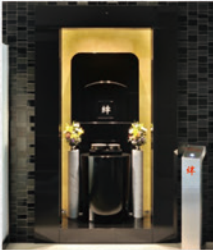
▲自動搬送式納骨堂 VIP「絆」