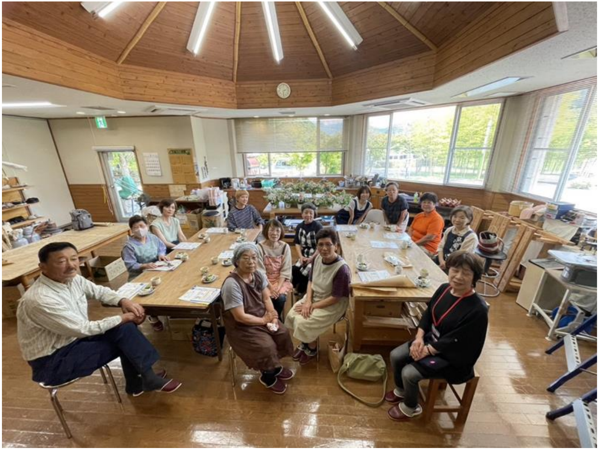
合馬竹林 素敵な空間で、みんなでおしゃべりしながらリフレッシュ✨