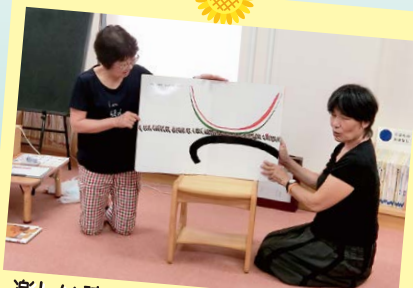
楽しい読み聞かせやパネルシアター!