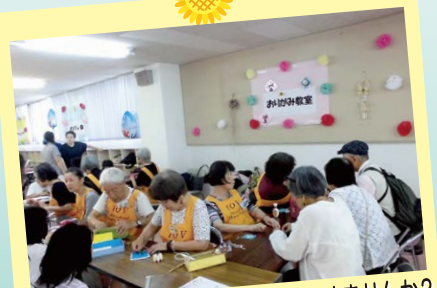
おりがみボランティアの活動ははじめませんか?