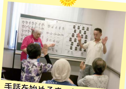
手話を始めるきっかけづくりに