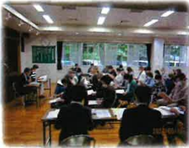
評議員会、お疲れ様でした！