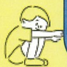
イラスト:社会医療法人 共愛会「子どもロコモ予防啓発パンフレット」より引用

問い合わせ先:戸畑区民生委員児童委員協議会事務局(戸畑区社会福祉協議会内) ☎871-3259 民生委員・児童委員は、地域福祉の担い手として、住民個々の相談に応じ、その生活課題の解決にあたりとともに、地域全体の福祉増進のための活動にも取り組んでいます。