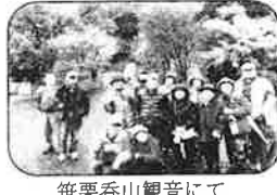
笹栗香山観音にて