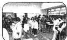
ぜんざいコーナー

市民センターは改装工事中ではありますが、天気にも恵まれ、実行面での支障も乗り越えて楽しい三世代間のふれあい交流の一日となりました。