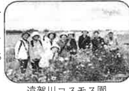
遠賀川コスモス園