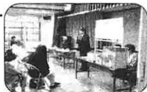
警察からのアドバイス