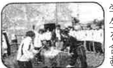
子どもの餅つき体験