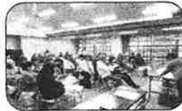
ホールいっぱいの参加者

夏の一大イベントは遠足でした。短い時間でしたが、ラウンドワンで、スマッシュピンポンやバースポールプールなどで楽しく遊ぶ事が出来ました。