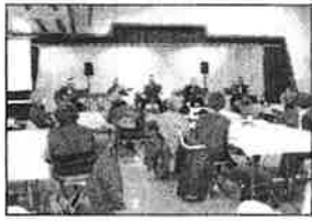
クリスマス会 G6の皆さんの演奏とみんなで合唱