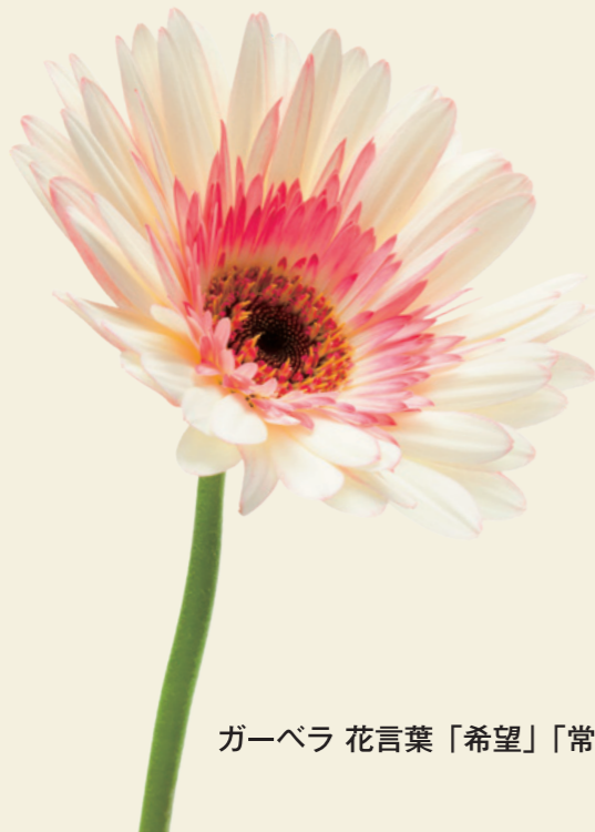
ガーベラ 花言葉「希望」「常に前進」

映画だって、小説だって、物語がおもしろくなってくるのは後半から。人生だって同じです。これからワクワクする展開に！ 年長者研修大学校は、北九州市在住の60歳以上の方々が入学でき、生きがいや健康づくり、社会参加できる知識や技能を学ぶ場所。これまで出会うことのなかった仲間たちも待っています。 今という時代にふれながら、一歩一歩成長していける1年間。 さあ、もう一度、あなたらしい学生時代を謳歌しませんか？