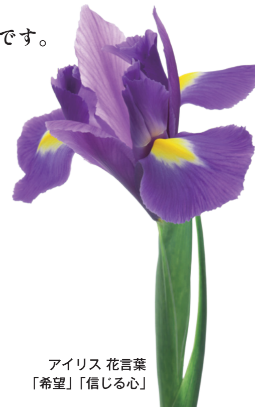
アイリス 花言葉 「希望」「信じる心」