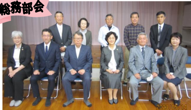
5月14日開催、評議員会での総務部会と来賓との写真撮影です。

総務部会は区、市との連携調整を図り、明るく安心して住み続けられる陣山地区を目指し、各部会との連携を取りながら、役員一同で努力してまいります。