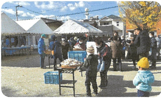
販売への準備中です