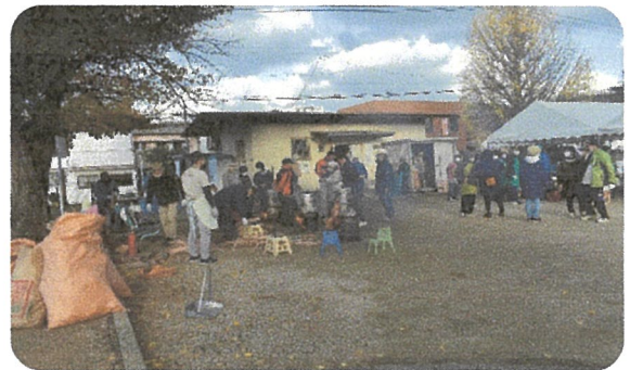
餅米をセイロで蒸します