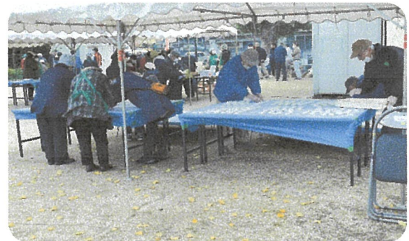
温かいお餅を冷まします