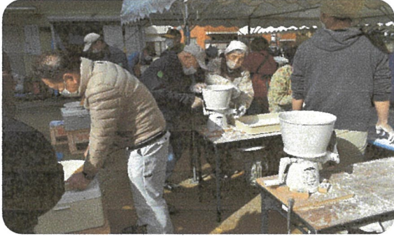
餅切り機でお餅を切ります