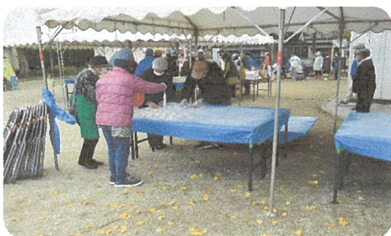
お餅を冷まします