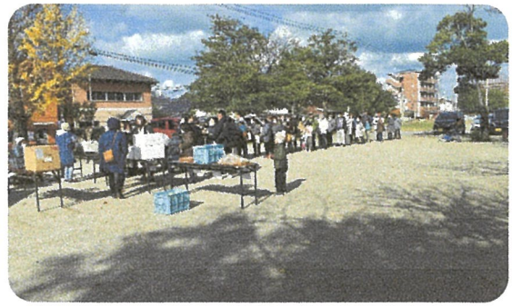
販売前に行列が出来ました