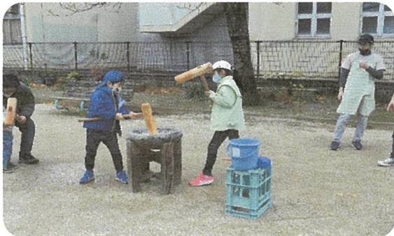
子どもたちのお餅つき其の1