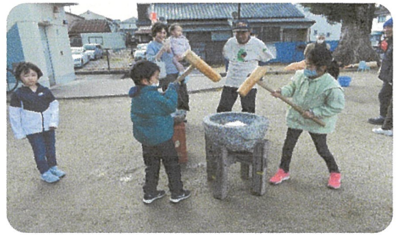
子どもたちのお餅つき其の6