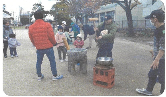
お父さんと一緒につきます其の2