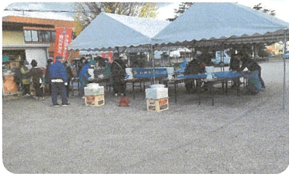
餅つき機も準備完了