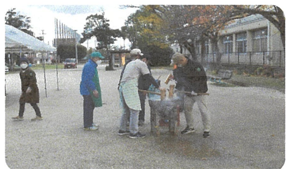
杵つきでは餅米をこねます