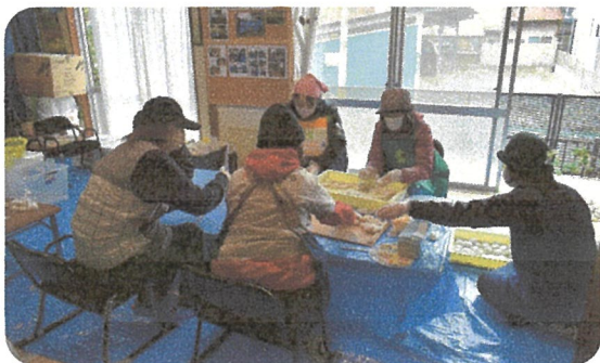
お餅の仕分けで奮闘中