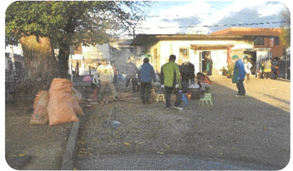
薪の準備から火起こし