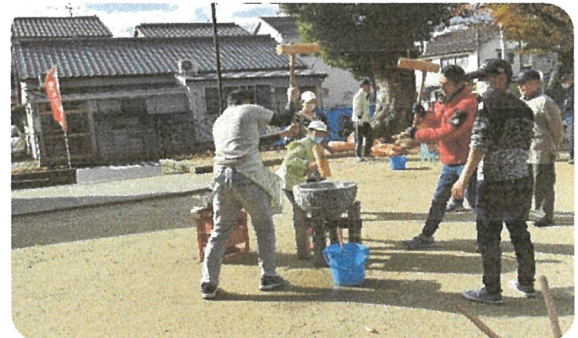
子どもたちのお餅つき其の2