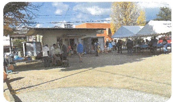
かまど等も片付けました