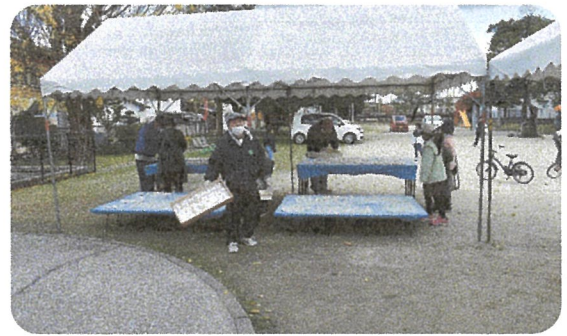
冷えたお餅を運んでいます