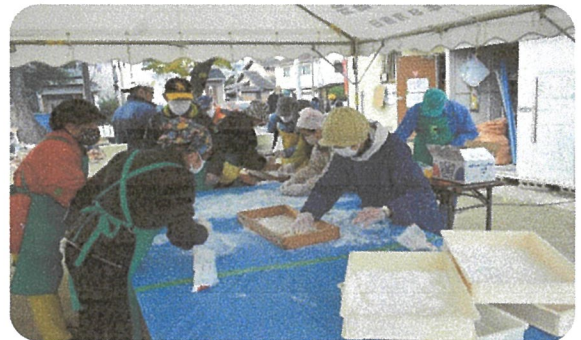
お餅をこねて形を整えます