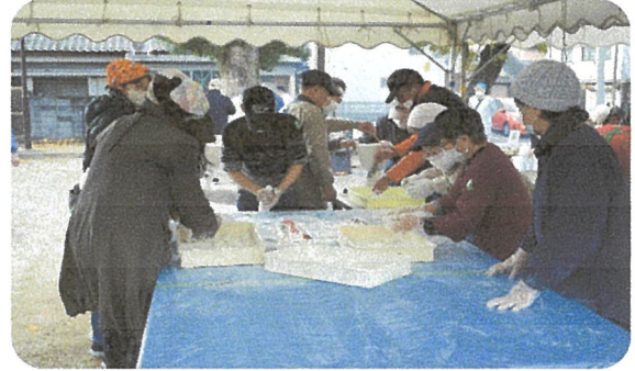
手を使ってお餅を切ります