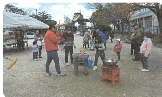
子どもたちのお餅つき其の3