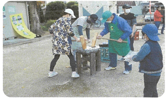
女性もお餅つきに参加