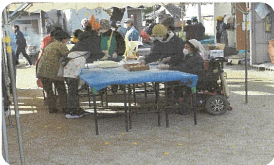
車椅子でもお手伝い出来ます