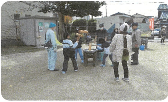
子どもたちのお餅つき其の5