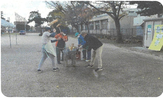
杵でのお餅つきです