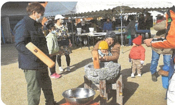
お父さんと一緒につきます其の3