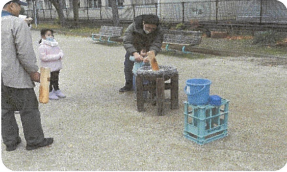
お父さんと一緒につきます其の1