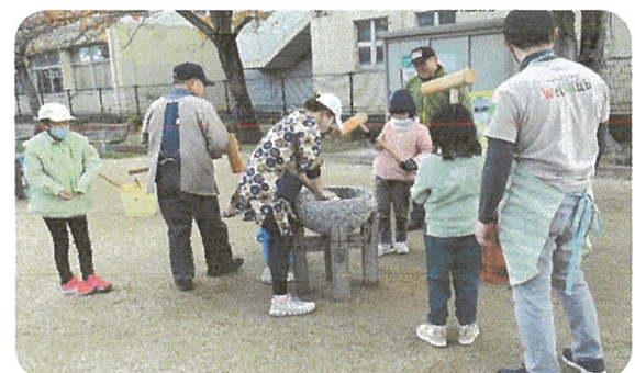
子どもたちのお餅つき其の4