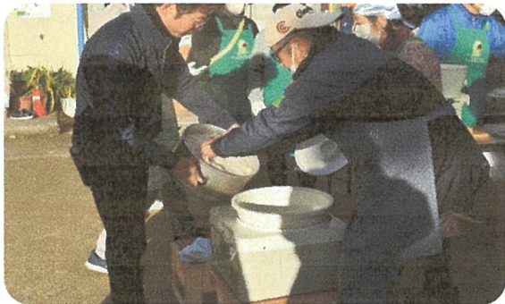
蒸しあがった餅米を餅つき機へ