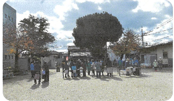
瞬く間に完売しました